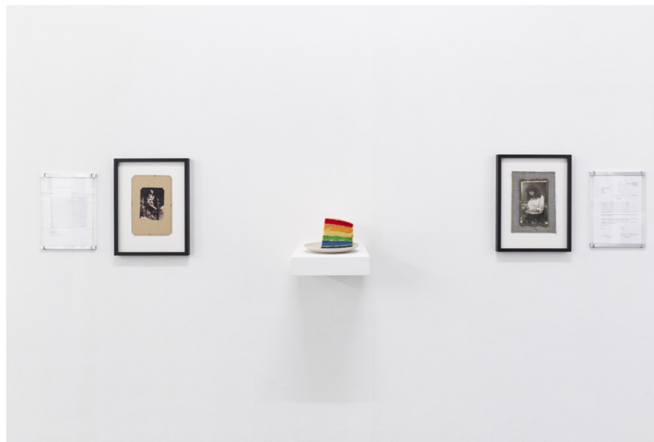
Tentoonstellingsoverzicht Öğüt \ Macuga \, Episode 1, Witte de With Center for Contemporary Art, Rotterdam, 2017.