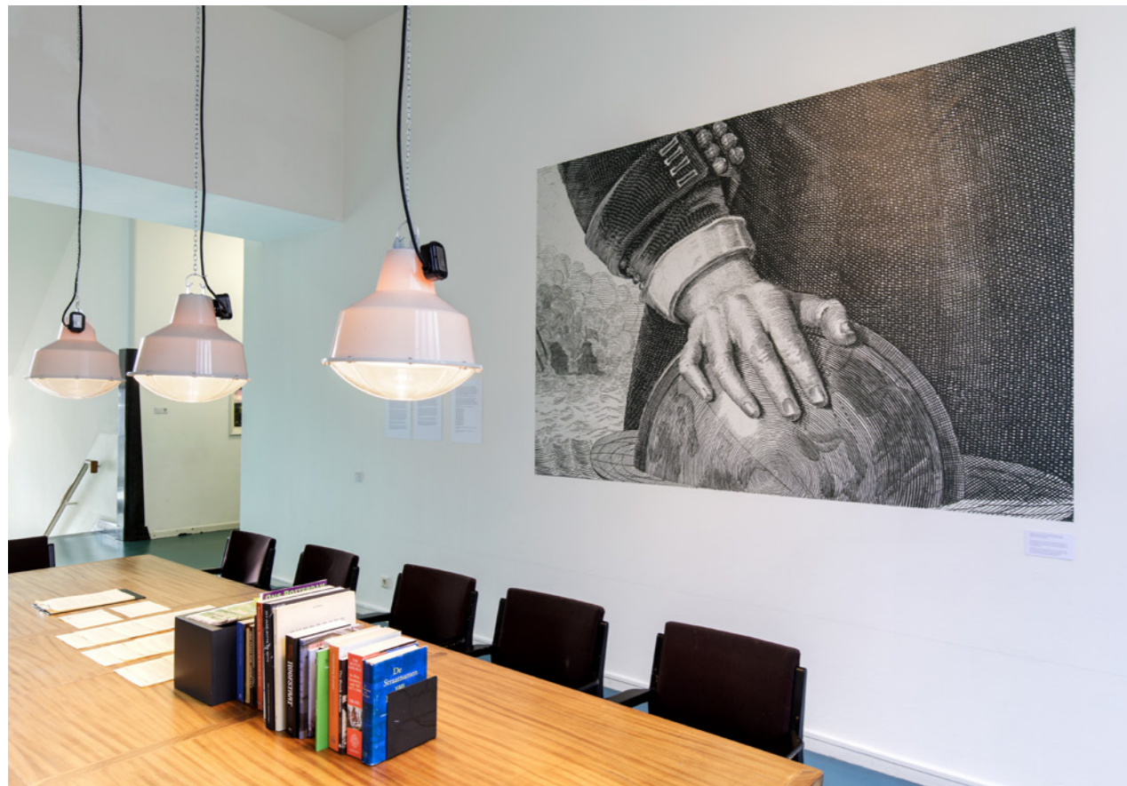
Rotterdam Cultural Histories #12: Witte de With; What's in a name?, Witte de With Center for Contemporary Art 2017.

Rotterdam Cultural Histories is een samenwerking tussen Witte de With en TENT, waarmee de gemeenschappelijke wortels in Rotterdam worden verkend en zo de raakvlakken tussen beide programma's. De serie vignettes, kleine presentaties, brengt bijzondere documenten en materialen die in bibliotheken en archieven verborgen zijn onder de aandacht en werpt daarmee een blik op het recente culturele verleden van Rotterdam. In 2017 werden in totaal drie edities gerealiseerd, die elk een uniek kunstproject of -fenomeen in Rotterdam centraal stelden. De presentaties vinden plaats in de gezamenlijke ruimte van Witte de With en TENT op de eerste verdieping van de Witte de Withstraat 50.