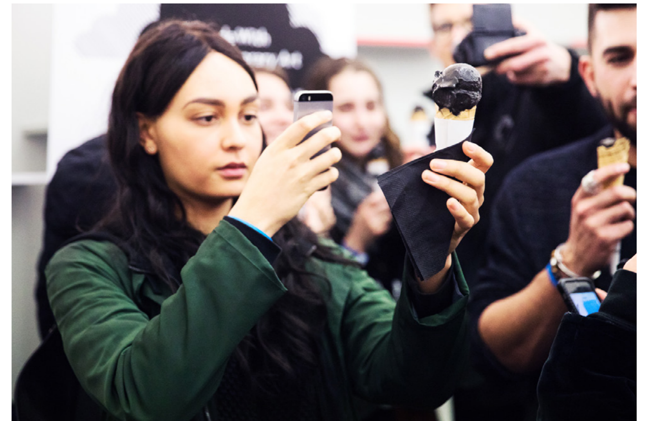
Bezoekers van Museumnacht 010 bij Witte de With Center for Contemporary Art, Rotterdam.

Om het programma onder de aandacht te brengen van diverse doelgroepen, op verschillende kennisniveaus en vanuit hun specifieke interesse, werkt Witte de With intensief samen met partners, lokaal, nationaal en internationaal. Conform het beleidsplan 2017-2020 zijn alle activiteiten erop gericht herhaalbezoek te stimuleren en bezoekers van andere culturele instellingen in Rotterdam ertoe aan te zetten ook naar Witte de With te komen.