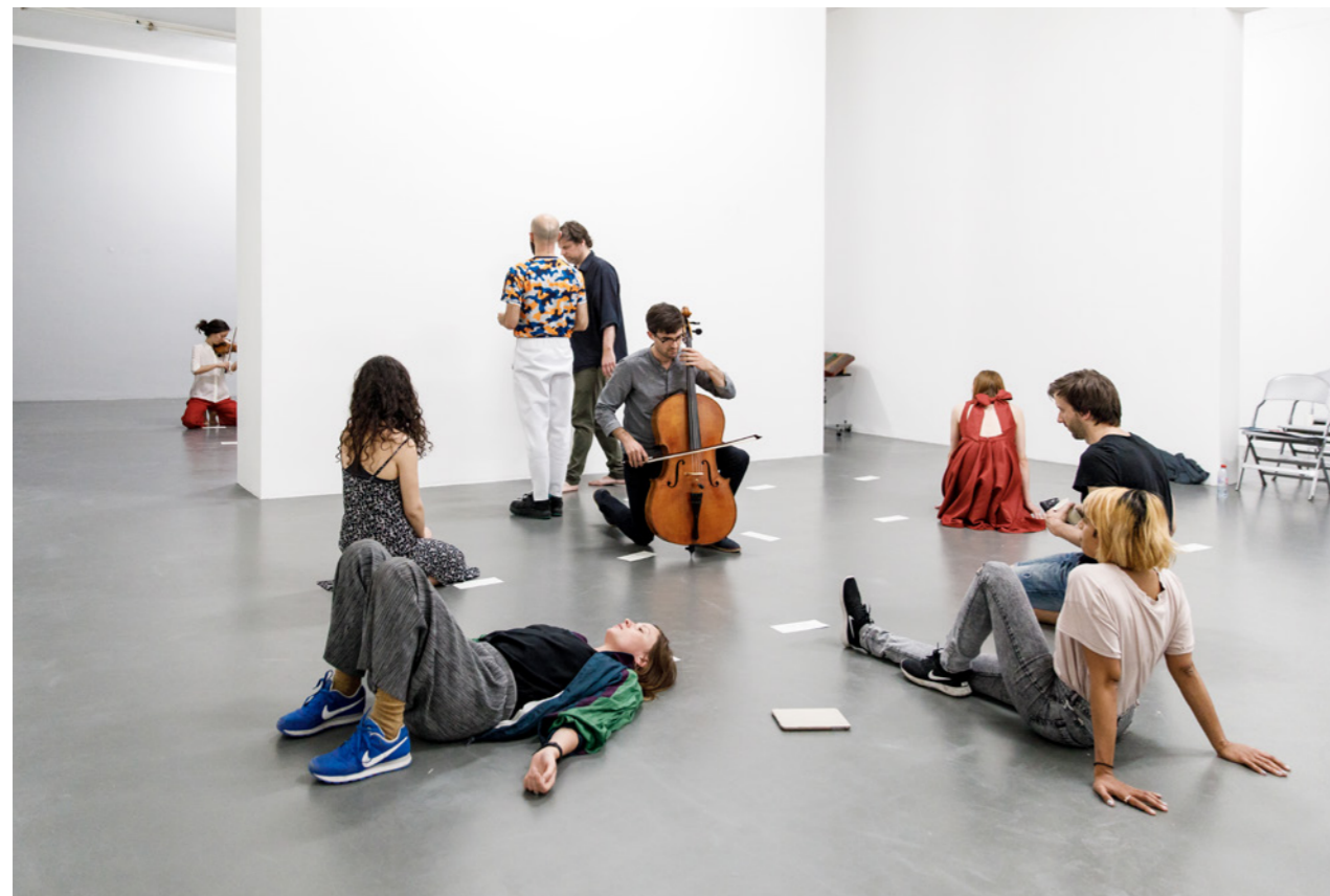
Workshops tijdens het symposium Music Is Not! A Conference On and Around the Kunsthalle for Music op 26-27 mei 2017 bij Witte de With Center for Contemporary Art.

Kunnen we ons een ruimte voorstellen voor muziek die buiten enig medium en voorbij het podium bestaat? Met deze vraag als vertrekpunt presenteert de Amerikaanse componist en kunstenaar Ari Benjamin Meyers de Kunsthalle for Music , ontwikkeld op basis van doorlopend onderzoek naar het oplossen van de afbakening tussen hedendaagse kunst en muziek.